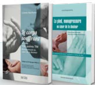
La globalité de la méthode détaillée

Cette praticienne a développé au cours de sa carrière professionnelle une méthode de soins qui puise ses racines dans l'acupuncture et ses points réflexothérapeutiques. Ce savoir-faire reconnu et apprécié a donné lieu à l'édition de deux ouvrages 3 publiés aux éditions Frison-Roche qui ont fait l'objet de cautions scientifiques avérées 4 .