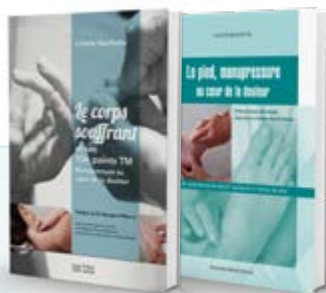
La globalité de la méthode détaillée

Cette praticienne a développé au cours de sa carrière professionnelle une méthode de soins qui puise ses racines dans l'acupuncture et ses points réflexothérapeutiques. Ce savoir-faire reconnu et apprécié a donné lieu à l'édition de deux ouvrages 3 publiés aux éditions Frison-Roche qui ont fait l'objet de cautions scientifiques avérées 4 .