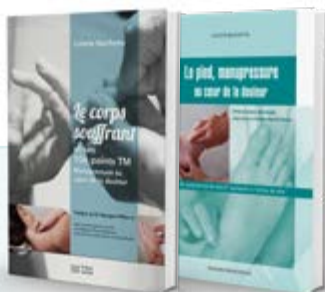
La globalité de la méthode détaillée

Cette praticienne a développé au cours de sa carrière professionnelle une méthode de soins qui puise ses racines dans l'acupuncture et ses points réflexothérapeutiques. Ce savoir-faire reconnu et apprécié a donné lieu à l'édition de deux ouvrages 3 publiés aux éditions Frison-Roche qui ont fait l'objet de cautions scientifiques avérées 4 .